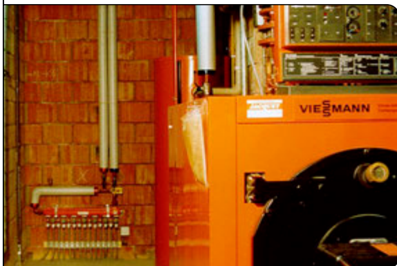
Blick in den Heizungskeller

Für die Fläche von 2.080 m 2 wurde das MB-Estrichsystem verwendet. Die Mauern des neueren Gebäudeteils bestehen aus Naturstein und Mauerwerk, die Räume mit Höhen zwischen 3 und 5 m erhielten einen Bodenbelag aus Fliesen und Teppichboden.