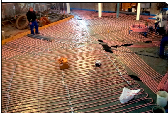
Blick auf die Verlegung der Heizrohre