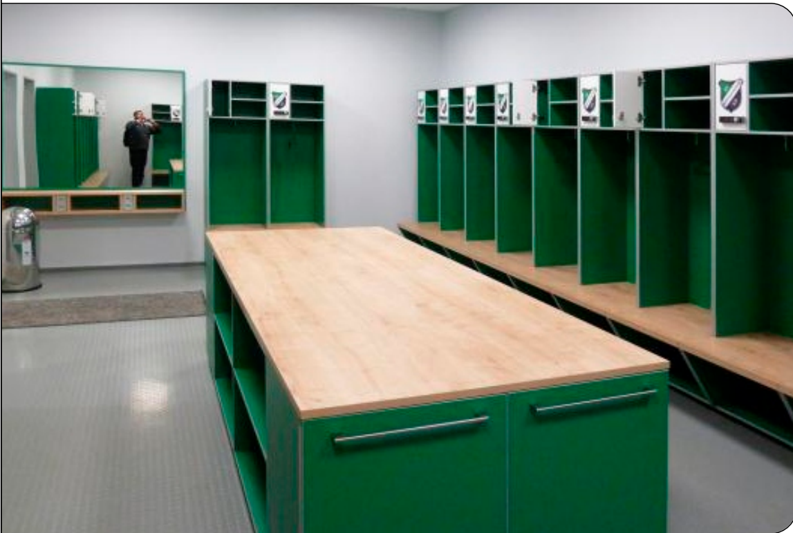
Umkleidekabinen mit Fußbodenheizung von MULTIBETON: Jeder Spieler der ersten Mannschaft hat hier seinen eigenen Bereich