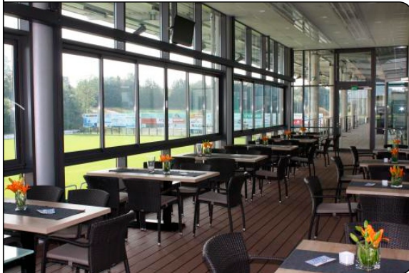
Stadionrestaurant mit großen Fensterflächen