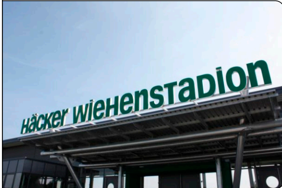
Schriftzug über dem Stadion