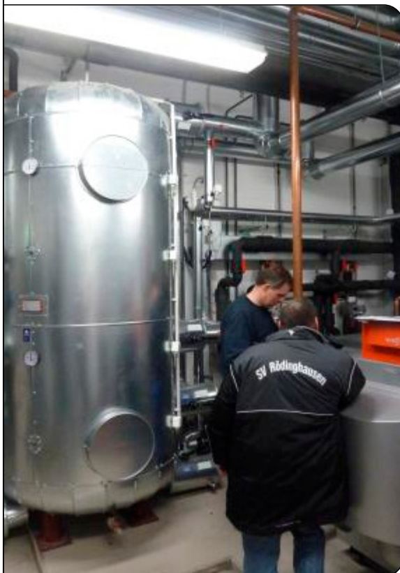
Pufferspeicher der Erdwärmanlage und Gaskessel

Das Häcker Wiehenstadion, errichtet vom Küchenhersteller Häcker nach den Plänen von Architekt Udo Steinbrink, wurde im Mai 2011 eröffnet und bietet nicht nur für den Verein, dessen Fans und Sponsoren eine einmalige und komfortable Spielstätte, sondern auch der ganzen Region rund um Rödinghausen. Die Heimspielstätte der Wiehenkicker bietet Platz für rund 2500 Zuschauer, davon 1489 überdachte Plätze auf der Haupttribüne. Neben einem VIP-Bereich mit 78 überdachten Sitzplätzen mit direktem Zugang zur gastronomischen Versorgung gibt es das Stadionrestaurant Beckmann's Sportsounge und sieben Presseplätze mit Pult.