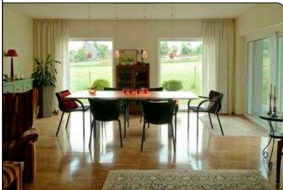
Parkett und Fensterflächen ohne störende Heizkörper