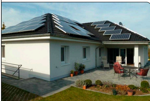
Blick auf Terrasse und Photovoltaikanlage