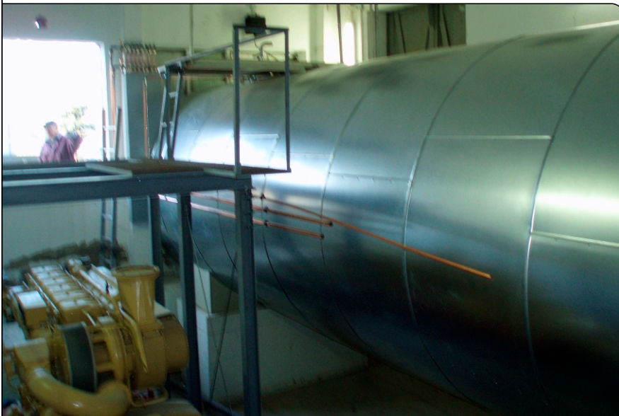
fertiger Tank mit Außenisolierung