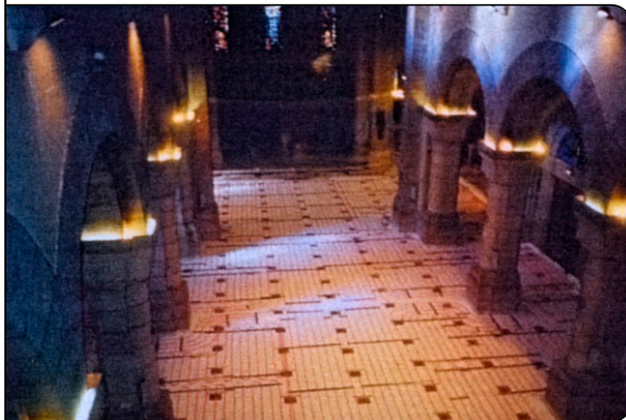
Blick ins Hauptschiff

Patrick Duvillard 83 Trans en Provence Frankreich