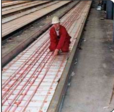
Verlegung der MB-Heizungsrohre