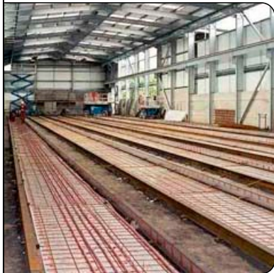
Blick in die Fabrikhalle