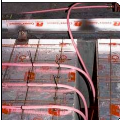
Schacht zum Verteiler

Eine Heizung mit ungewöhnlicher Zielsetzung hat die Firma Bison Beams in England 2001 in ihrer neuen Fabrik verwirklicht: eine Halle zur schnelleren Aushärtung von fabrikgefertigten Betonfertigteilen. Geplant wurde das Projekt durch MULTIBETON Ltd., Generallizenznehmer für Großbritannien.