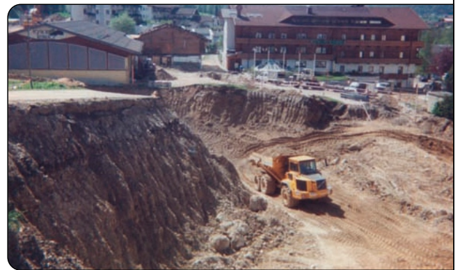
Neubau der Tiefgarage