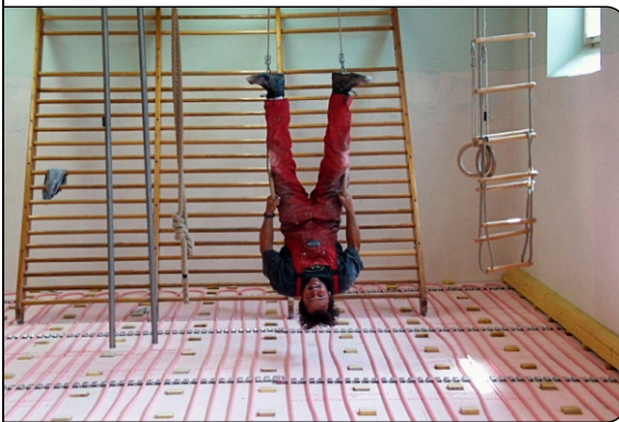
Spaß bei der Verlegung mit MULTIBETON