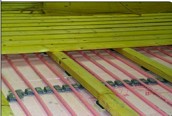
Einblick in den Schwingboden

Die MULTIBETON-Fußbodenheizung unter Sportböden garantiert für eine gleichmäßige Wärmeabgabe über die Gesamtfläche der Halle und sorgt so für ein gleichmäßiges und optimales Temperaturniveau. In der Turnhalle der Volksschule von St. Marein im Mürztal wurde 1998 ein MB-Schwingboden installiert.