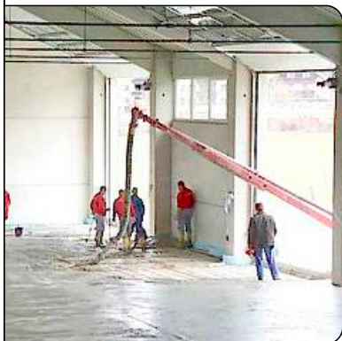
Einbringung des Fließestrichs

Die Firma Pagitsch GmbH aus Tamsweg hat 1998 auch ihre zweite Produktionshalle mit einer MULTIBETON-Fußbodenheizung ausstatten lassen. In der Halle werden das Trockenausbau- und Stuckprogramm des Unternehmens hergestellt: Stuckarbeiten, Gipskartonständerwände, Schall- und Gipsdecken, mobile Trennwände bis hin zu Metallpaneeldecken, Rasterdecken und Mineralfaserdecken, die durch die Fußbodenheizung schnell und gleichmäßig trocknen können.