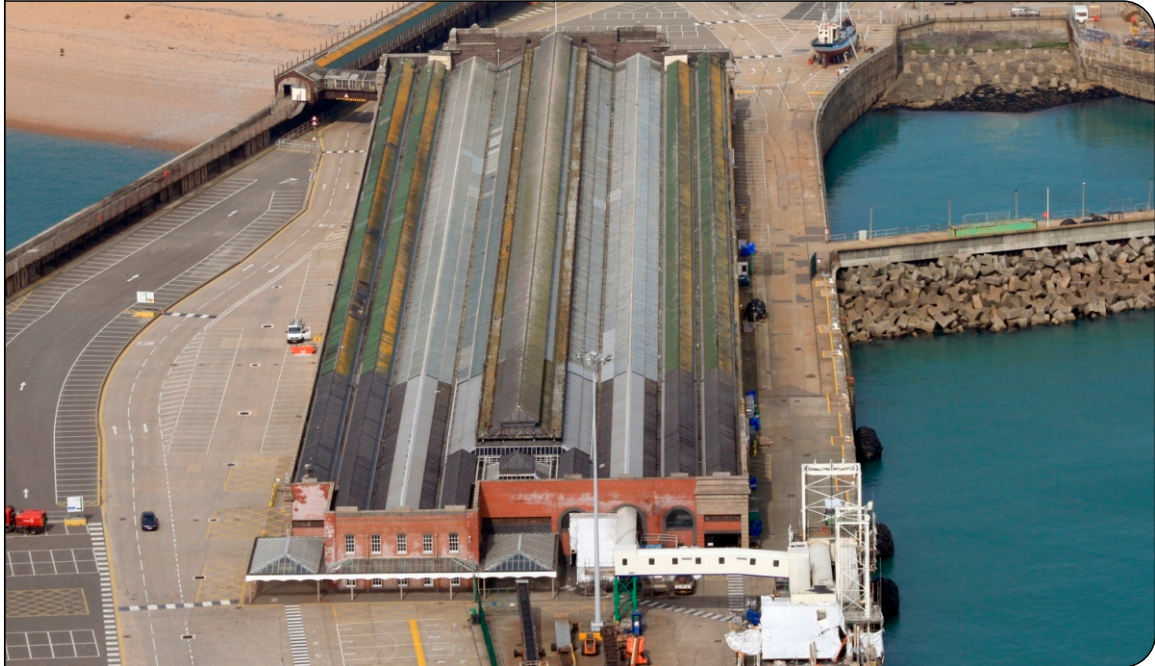
Dover Cruise Terminal aus der Luft